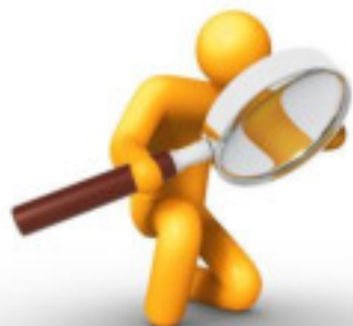
Google Quality rater